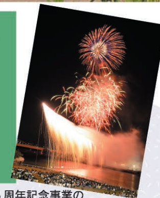
市制施行45周年記念事業の花火大会